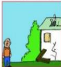
Lontano da costruzioni

Allontanati da costruzioni e linee elettriche, potrebbero crollare