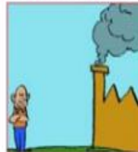
Lontano da impianti

Stai lontano da impianti industriali e linee elettriche, è possibile che si verifichino incendi