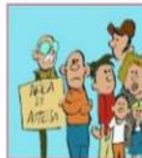
Si, aree di attesa

Evita di andare in giro a curiosare e raggiungi le aree di attesa individuate dal piano di emergenza comunale perchè bisogna evitare di avvicinarsi ai pericoli