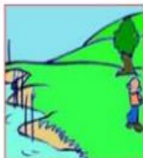
Lontano da acque

Stai lontano dai bordi dei laghi e delle spiagge marine, si possono verificare onde di tsunami