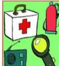
Si, cassetta primo soccorso

Tieni in casa una cassetta di primo soccorso , una torcia elettrica, una radio a pile, un estintore ed assicurati che ogni componente della famiglia sappia dove sono riposti