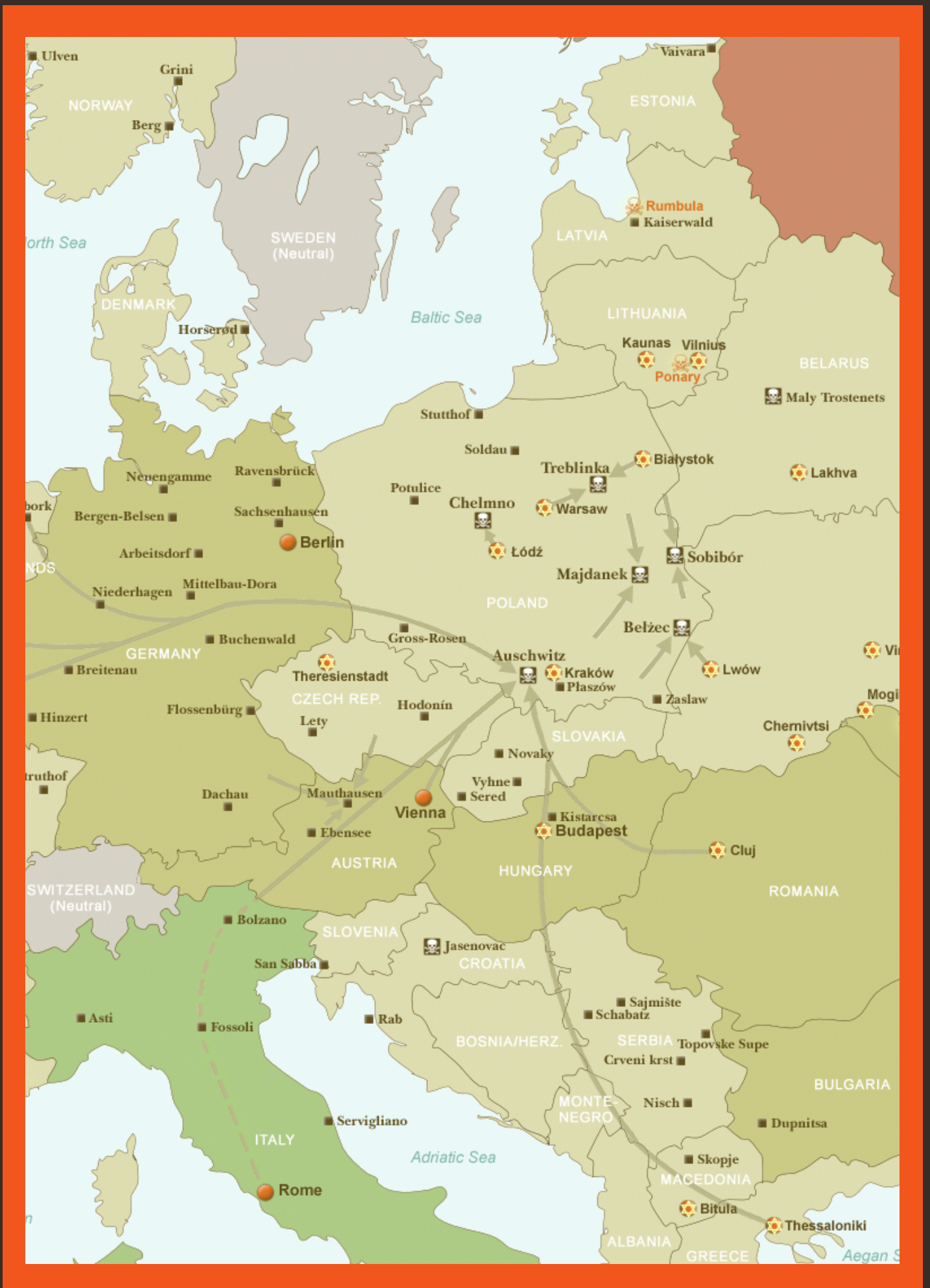
I luoghi della memoria.